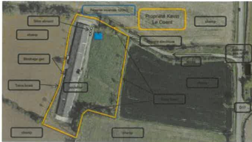
L'occupation du site ne sera pas modifiée puisque le bâtiment ne sera pas agrandi