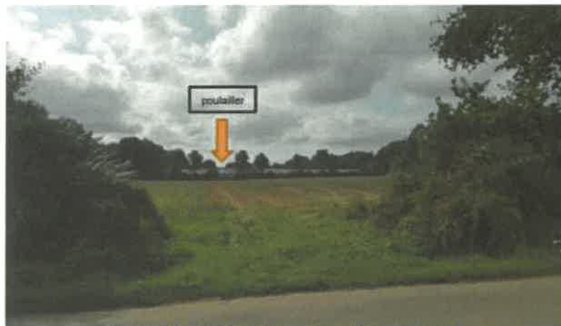
Vue de la D17 au droit du poulailler au niveau d'une entrée de champ